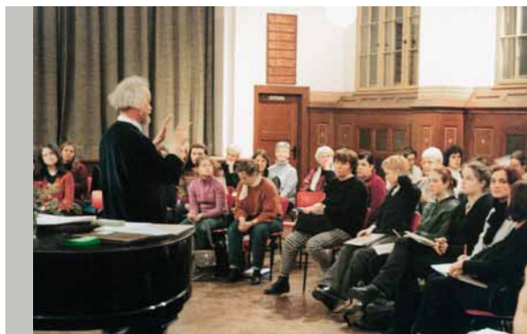
»Singt und swingt! Von der Lust am Kirchenchor« lief 2001 im MDR FERNSEHEN.

Das kirchliche Finanzierungswesen steht im Bezugssystem einer institutionellen Trennung von Kirche und Staat. Zu den Merkmalen dieses Systems gehören die Achtung der Religionsfreiheit auch im Blick auf die gemeinschaftliche Ausübung der Religion, das Selbstbestim-