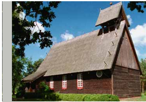
Die Fischerkirche von Born in der Reihe »Dorfkirchen – die Schönen vom Lande« des NDR Fernsehens

hat die Debatte über »Schleichwerbung« und »Product Placement« den Wert solcher institutioneller Tugenden anschaulich gemacht. Die Transparenz von Strukturen und Entscheidungen ist für die Kirchen genauso wichtig, wie die Qualität ihrer Angebote und die Mitwirkungsbereitschaft ihrer Mitglieder konstruktiv aufzunehmen.