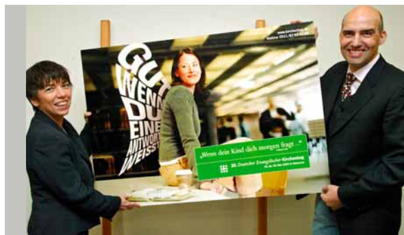
»Wenn Dein Kind Dich morgen fragt«, Sendung zum 30. Deutschen Evangelischen Kirchentag in Hannover 2005 auf WDR3: Landesbischofin Margot Kässmann und Kirchentagspräsident Eckhard Nagel präsentieren das Kirchentagsplakat.

geordnetes kirchliches Amt. Angesichts einer staatlichen Macht, die den eigenständigen Öffentlichkeitsauftrag der Kirche »gleichschalten« wollte, heißt es in der Barmer Theologischen Erklärung von 1934, dem wichtigsten Bekenntnisdokument aus der Zeit des Kirchenkampfes: »Der Auftrag der Kirche, in welchem ihre Freiheit gründet, besteht darin, an Christi Statt und also im Dienst seines eigenen Wortes und Werkes durch Predigt und Sakrament die Botschaft von der freien Gnade Gottes auszurichten an alles Volk.«