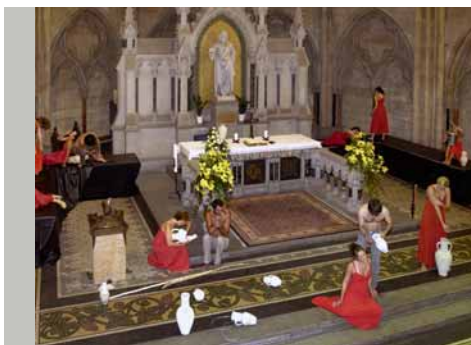
»... damit Gerechtigkeit fließt«: evangelischer Gottesdienst aus der Gedächtniskirche in Speyer zur Eröffnung der Hilfsaktion »Brot für die Welt« am 28. 11. 2004 im Ersten mit dem »Theatro Piccolo«

Damit war der Grundstein für Anerkennung des öffentlichen Wirkens der Kirchen gelegt, die in der Nachkriegszeit einsetzte. Grundlagen, Legitimation und Ausprägungen dieses Öffentlichkeitsauftrags der Kirche sind seitdem immer wieder erörtert worden. Trotz aller Differenzen gibt es »seit den Erfahrungen der NS-Periode im Rahmen der EKD, unterstützt durch viele Stimmen aus der Ökumene, einen breiten Strom von Meinungen ... , die jedenfalls darin übereinstimmen, dass es dem Christen und den christlichen Gemeinden nicht erlaubt ist, die Welt ihrer angeblichen Eigengesetzlichkeit zu überlassen und nur dem eigenen Seelenheil zu leben, andererseits aber auch verwehrt ist, in sozialen oder politischen Systemveränderungen und der Verwirklichung bestimmter Gesellschaftsordnungen das Kommen des Gottesreiches meinen vorwegnehmen zu können. Da Christi Versöhnungstat allen Men-