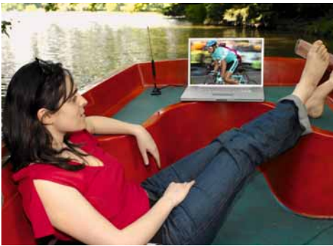
DVB-T-Empfang im Freien

Zunächst ist zu berücksichtigen, dass bundesweit noch rund 27 Prozent aller Haushalte über zumindest eine terrestrische Empfangsmöglichkeit verfügen, oft an Zweit- und Drittgeräten in Kombination mit einem Kabel- oder Satellitenanschluss für das Hauptgerät. In den Ballungsräumen liegt dieser Wert zum Teil noch höher. Die antennengebundene Verbreitung spielt daher, unabhängig von der üblicherweise nur auf die Erstgeräte abgestellten Zählweise der Gesellschaft für Konsumforschung (GfK), für die Fernsehversorgung nach wie vor eine wichtige Rolle.