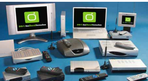
DVB-T-Decoder und Zimmerantenne

Set-Top-Boxen bieten eine einfache Möglichkeit, auf DVB-T umzusteigen, da sie mit wenigen Handgriffen zwischen Antenne und herkömmlichen analogen Fernseher gesteckt werden. Bei Fernsehern mit integriertem Empfänger handelt es sich meist um Geräte, die einen festen Standort im Haushalt haben und von einer Dach-, Außen- oder Zimmerantenne gespeist werden. Inzwischen bieten einzelne Hersteller auch kleine Fernsehgeräte mit integriertem DVB-T-Empfangsteil für die portable Nutzung an.