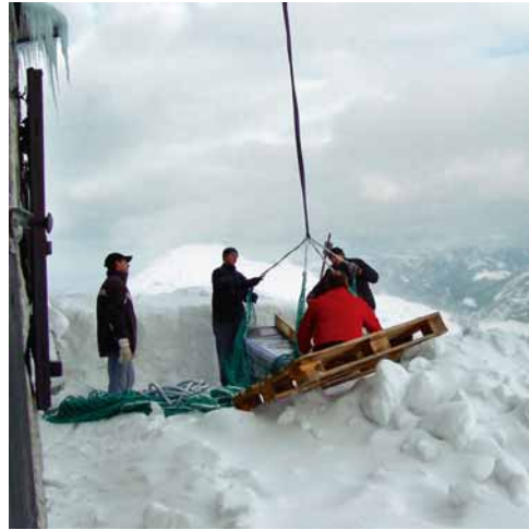
Vorbereitungen für den DVB-T-Start in Bayern im Mai 2005; neue Sendeanlage für den Standort Wendelstein

Die Fernsehverbreitung über Antenne als kostengünstiger, mittlerunabhängiger, von Zugangsbeschränkungen freier Vertriebsweg hat sich für den öffentlich-rechtlichen Rundfunk über Jahrzehnte hinweg als unverzichtbar zur Erfüllung seines Grundversorgungsauftrags erwiesen. Mit der Umstellung auf DVB-T wird dieser Verbreitungsweg nun modernisiert. Er sichert damit ein deutlich breiteres Programmangebot bei langfristig sinkenden Ausstrahlungskosten und bietet so einen Mehrwert für